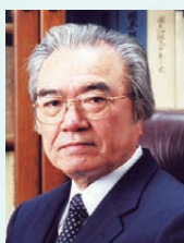
大谷 實 学校法人同志社 総長

同志社は、キリスト教主義、自由主義、国際主義を基礎とした良心教育に特色があり、「天真爛漫として、自由のうち自ら秩序を得、不羈の内自ら裁制あり、すなわち独自一己の見識を備え、仰いで天に愧ず、俯して地に愧ない」良心の充満した人物の養成を目指しております。