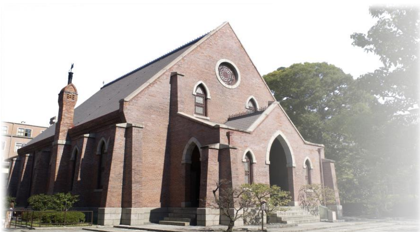
同志社礼拝堂（チャペル）