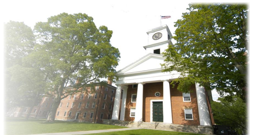
アーモスト大学 ジョンソン・チャペル