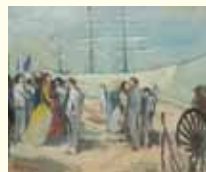
絵画「ボストン上陸」